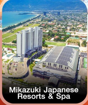
Mikazuki Japanese Resorts & Spa